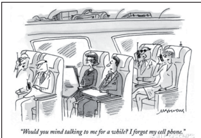
Abbildung 2: Interkulturelle kommunikative Kompetenz und die Beherrschung sprachlicher Mittel

Sollen die Schüler und Schülerinnen z. B. die Kompetenz erwerben, höfliche Aufforderungen oder Bitten in der Fremdsprache Englisch auszusprechen, reduziert sich dies nicht auf das Erlernen grammatisch korrekter Formen und der notwendigen Lexik, die als Basiswissen lediglich dienende Funktion haben. Im Beispiel (siehe Abbildung 2) steht die interkulturelle kommunikative Kompetenz, welche die Schüler und Schülerinnen befähigt, situativ adäquat zu (re)agieren, indem sie ihr Gegenüber nicht mit einer Befehlsform brüskieren, im Vordergrund. Die Lernenden müssen natürlich trotzdem über die entsprechenden lexikalischen Mittel verfügen und befähigt werden, die notwendigen grammatischen Formen korrekt zu bilden und zu verwenden.